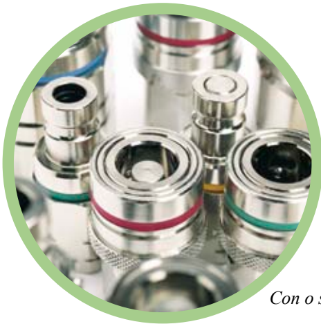
Con o sin Válvula

Esta serie de fluidos incluye acoplamientos y espigas con y sin válvula que cubren todas las aplicaciones. Las versiones con válvula se manipulan con una sola mano y son las más utilizadas en aplicaciones de fluidos. Los acoplamientos sin válvula suelen utilizarse en aplicaciones donde la pérdida de fluidos en la desconexión no es un punto crítico.