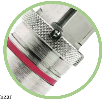
Casquillo de seguridad