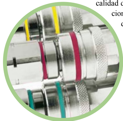
Codificación por colores disponible

Para asegurar la total estanqueidad y un paso de caudal constante, exigencias fundamentales en los sistemas de fluidos, los acoplamientos CEJN superan estrictos controles de calidad que garantizan un funcionamiento óptimo allí donde es más importante, en el puesto de trabajo.